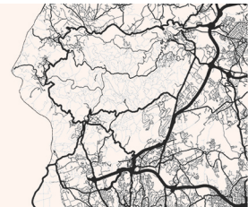
Figura 2: Figura em largura inteira e alinhamento com o texto.