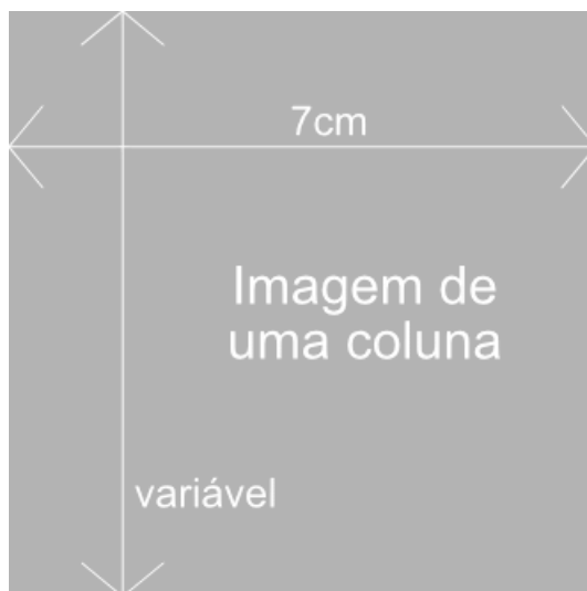
Figura 1: Figura em uma coluna.

Todos os elementos sem indicação explícita de fonte serão incluídos como tendo sido elaborados pelos autores, que devem estar cientes dessa condição.